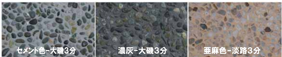
セメント色-大磯3分